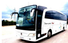
D1, D1E, D ili DE kategorije