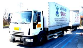
C1, C1E, C ili CE kategorije